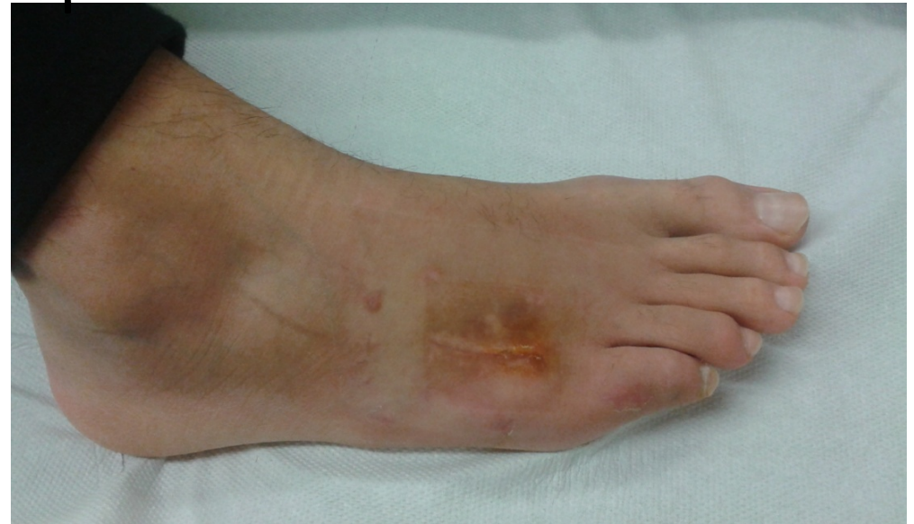
1 μήνα μετά τη θεραπεία